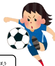
じょし 女子サッカー