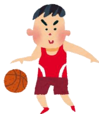
ミニバスケットボール