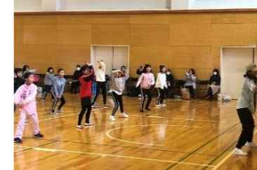
ヒップホップダンス