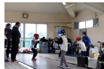
フェンシング教室